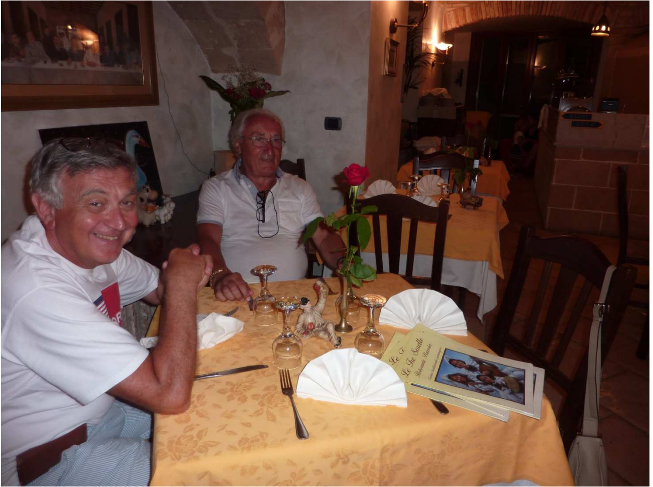
06 settembre 2015 Gallipoli al ristorante "le tre sorelle"