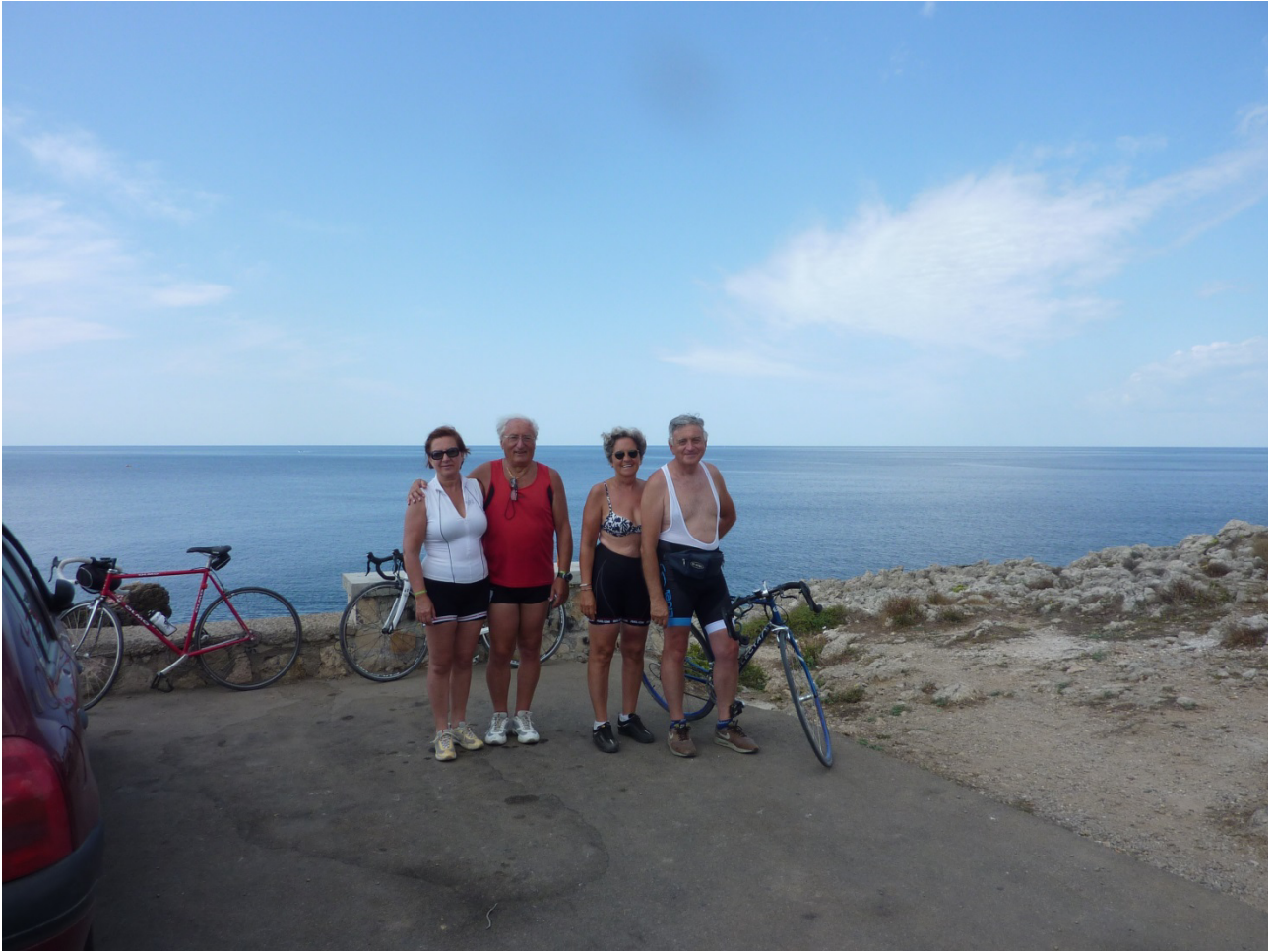
07 settembre 2015 Gallipoli foto ricordo alla fine della litoranea