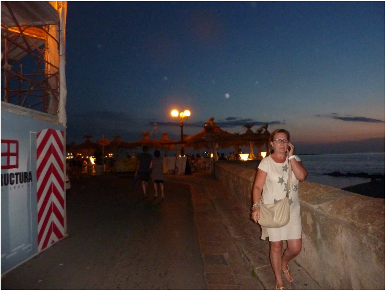
06 settembre 2015 Gallipoli passeggiata in riva al mare con ..... telefonino