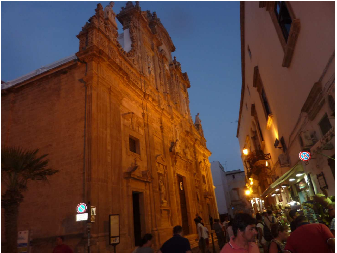
06 settembre 2015 Gallipoli Basilica di Sant'Agata