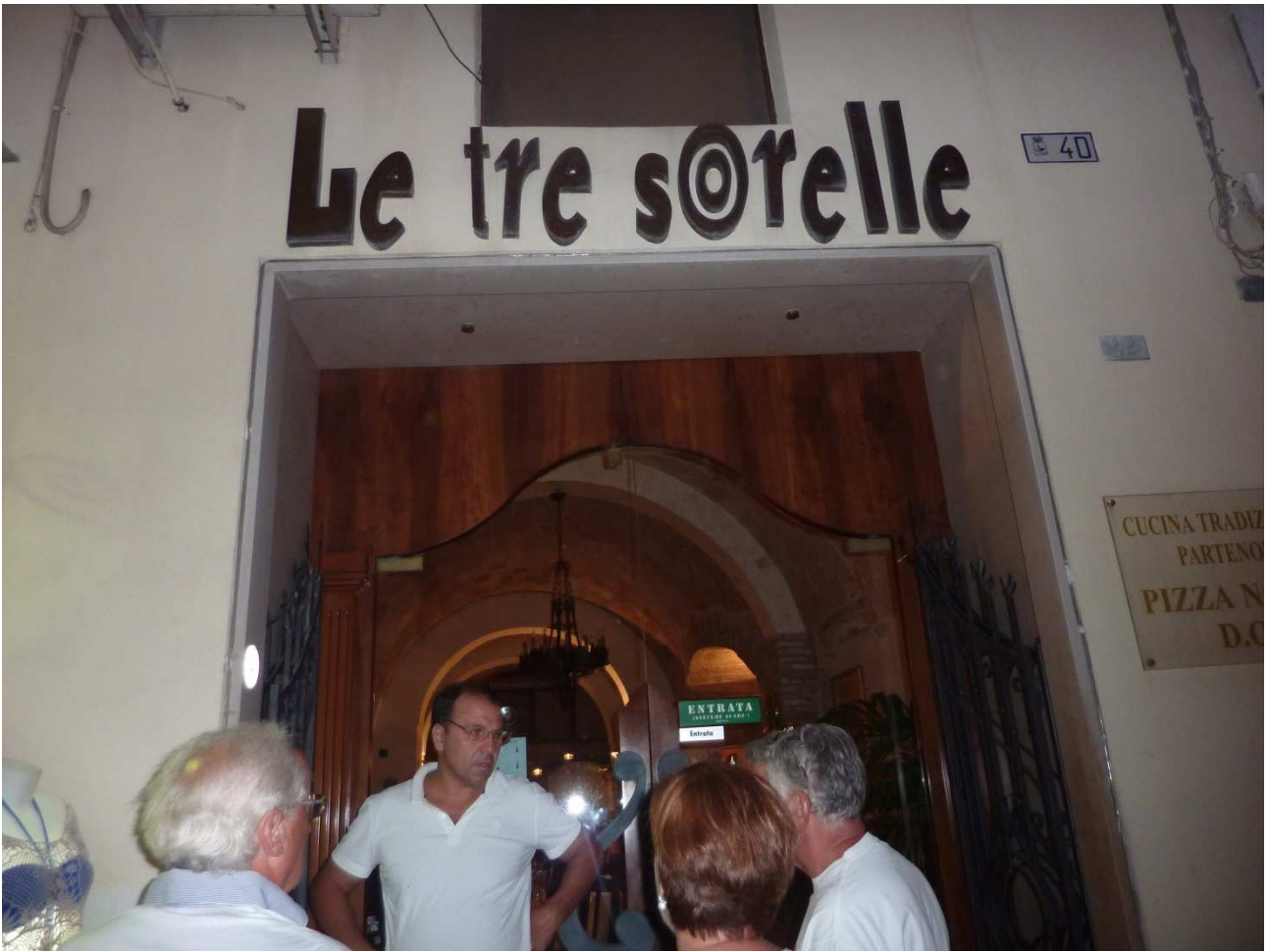
06 settembre 2015 Gallipoli ristorante dove ceneremo (bene)