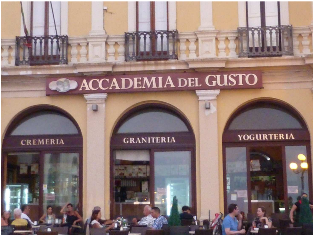
06 settembre 2015 Gallipoli bar pasticceria in centro