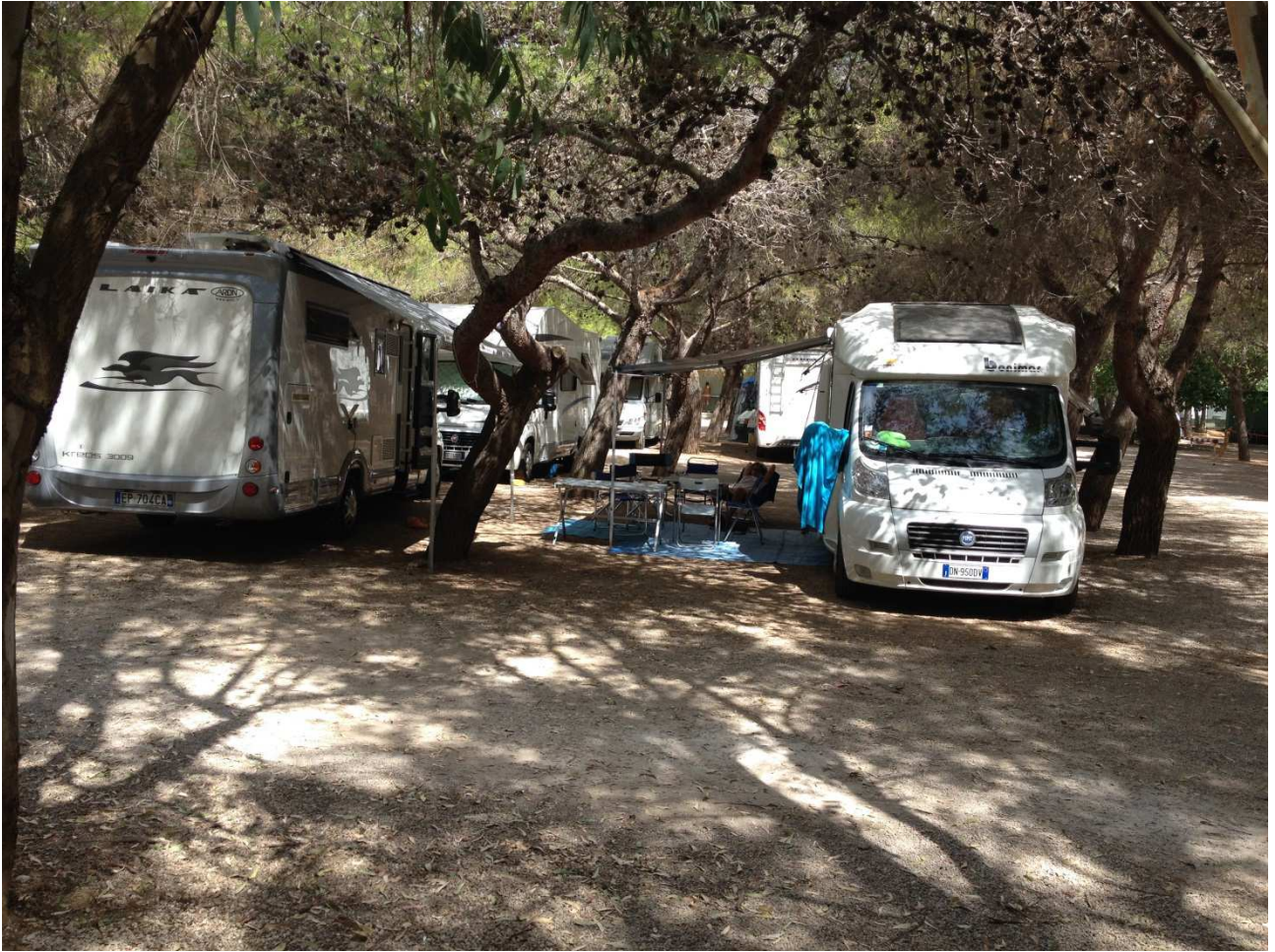
06 settembre 2015 Gallipoli camping La Masseria