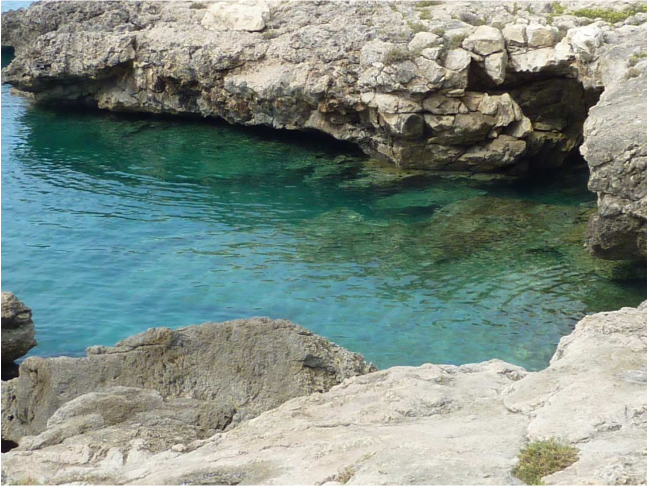
07 settembre 2015 Gallipoli le calette viste dalla bici sulla litoranea verso nord