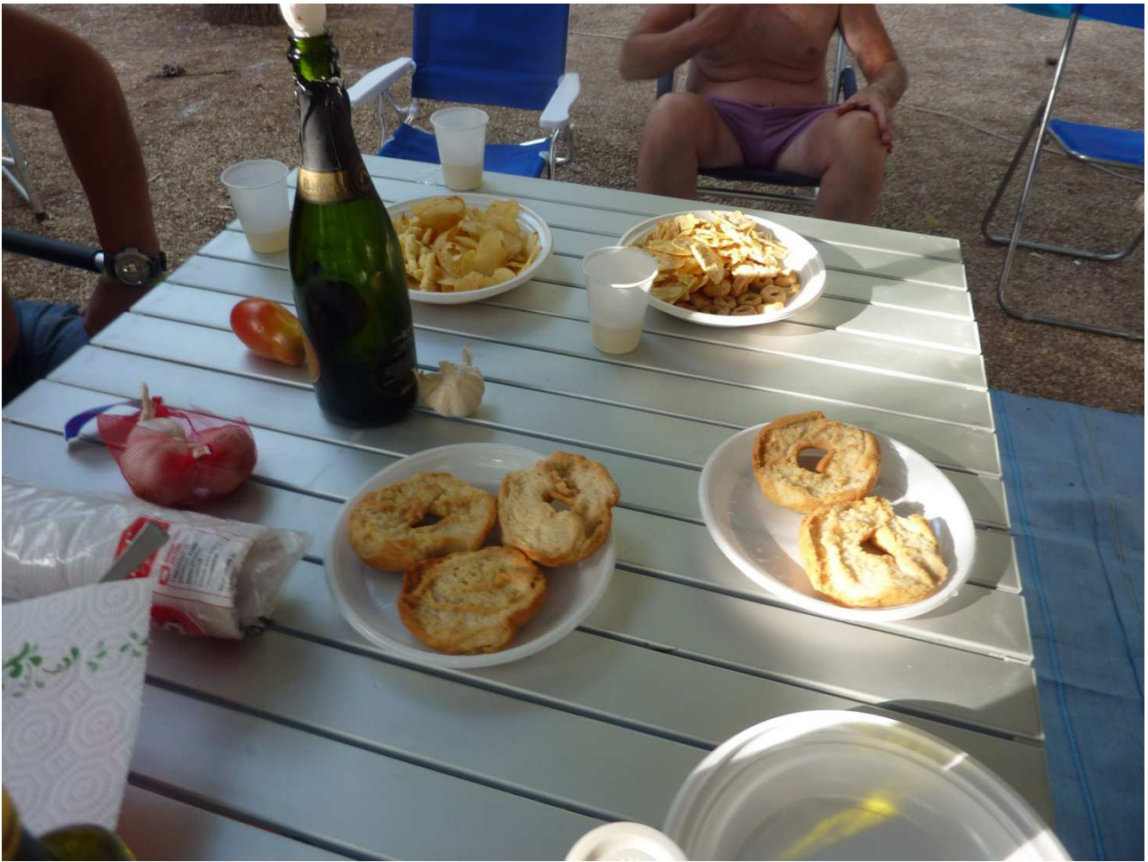
06 settembre 2015 Gallipoli camping La Masseria ..... specialità pugliesi