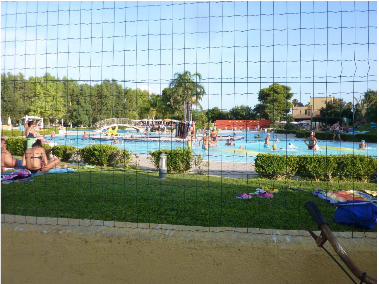
06 settembre 2015 Gallipoli camping La Masseria ..... piscina