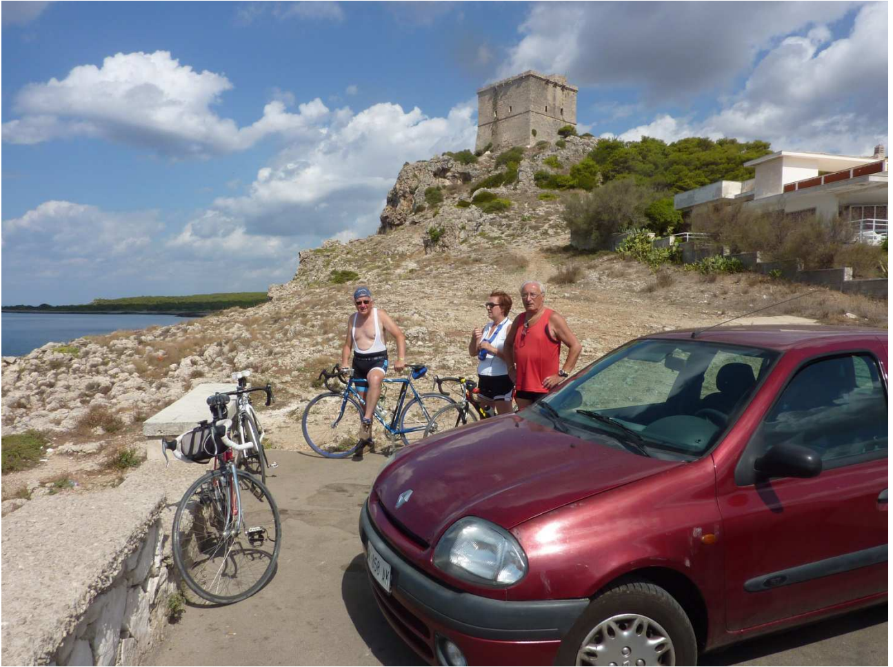
07 settembre 2015 Gallipoli la litoranea verso nord finisce qui