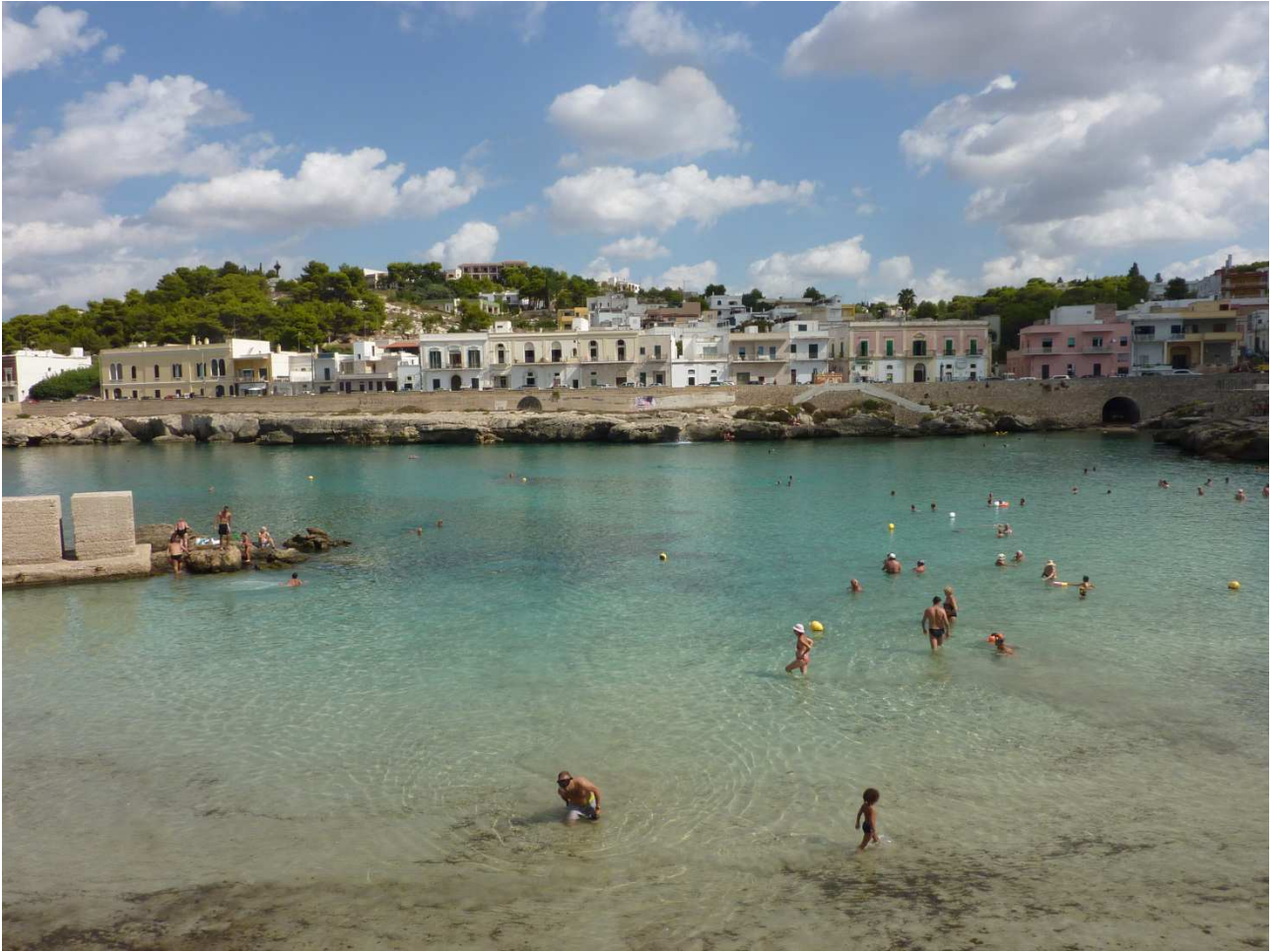
07 settembre 2015 Gallipoli le calette viste dalla bici sulla litoranea verso nord