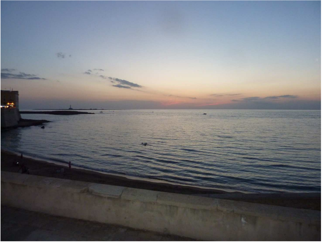
06 settembre 2015 Gallipoli Tramonto