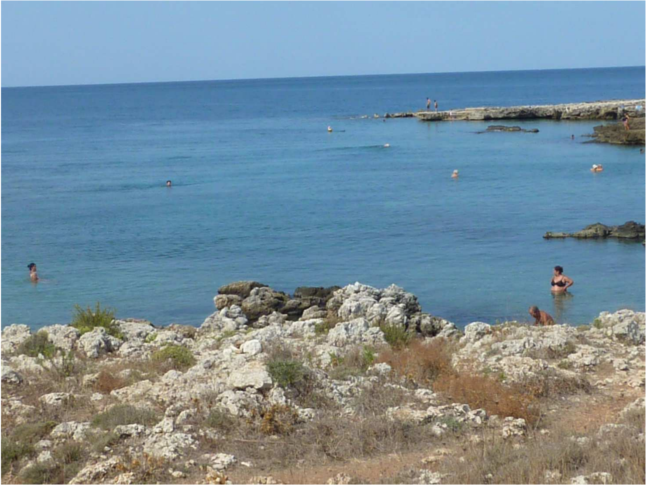
07 settembre 2015 Gallipoli le calette viste dalla bici sulla litoranea verso nord