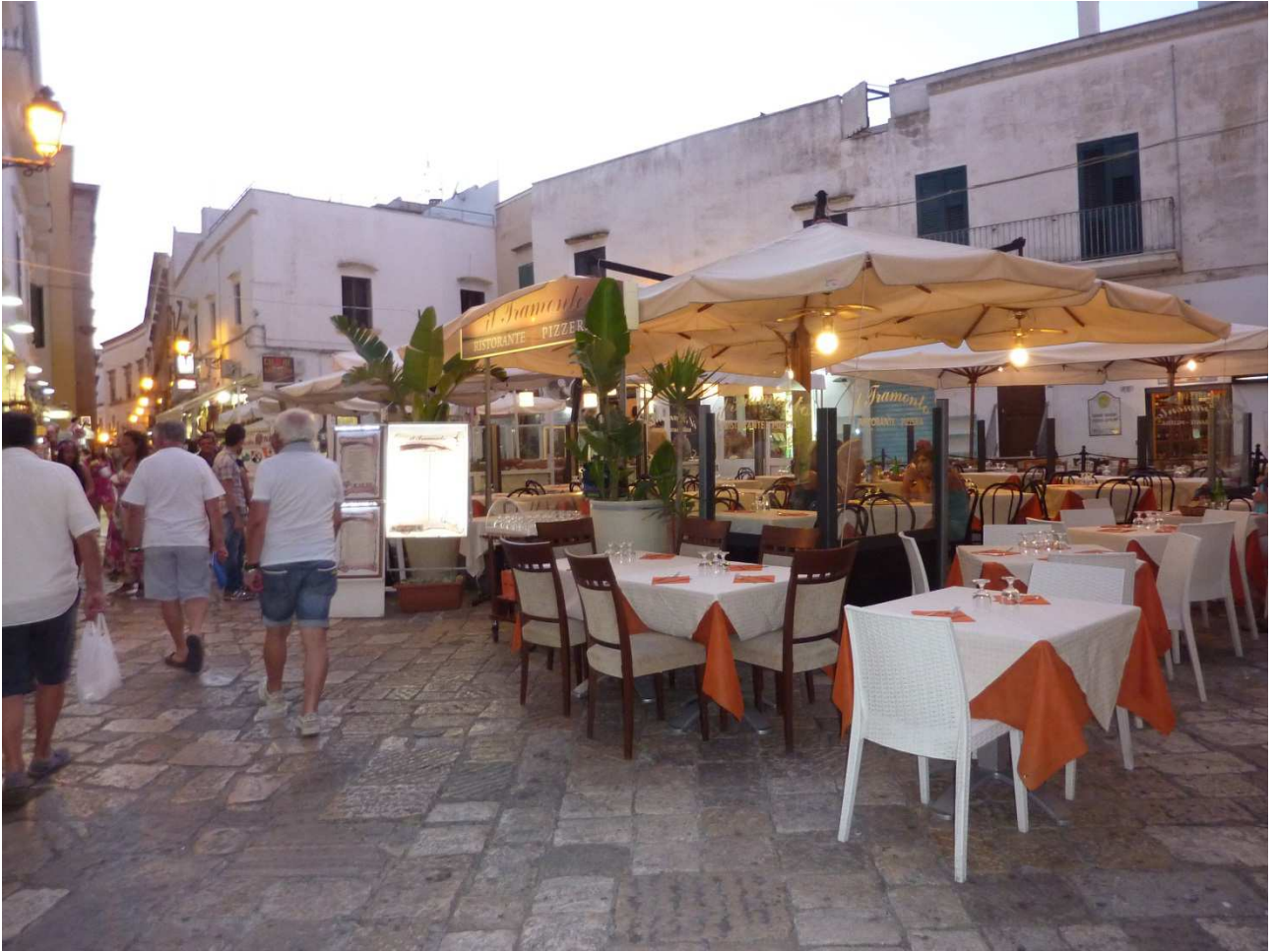
06 settembre 2015 Gallipoli a passeggio per le vie del centro